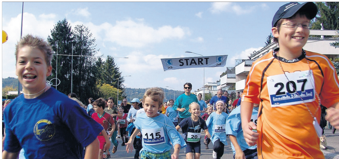
ALLE KÖNNEN MITMACHEN Laufen und ein Zeichen gegen die Gleichgültigkeit setzen.

Der Limmattaler 2-Stunden-Lauf ist eine Aktion der sieben reformierten Limmattaler Kirchgemeinden. Als Läuferin oder Läufer sucht man sich vor dem Lauf möglichst viele «Sponsoren» bei Freunden und Freundinnen, Verwandten, Nachbarn, Firmen und Vereinen, die einem für jeden in zwei Stunden gelaufenen Kilometer einen bestimmten Geldbetrag zusagen. Am Lauf entscheidet man selber, wie viele Kilometer man zurücklegt. Der ideale Rundkurs um das Weihermatt- und Bärenweihergelände beträgt 2,3 Kilometer und ist während zwei Stunden geöffnet. Die Teilnehmer dürfen ihren Lauf jederzeit unterbrechen oder frühzeitig beenden. Je weiter man läuft oder marschiert, umso mehr Geld kann zur Realisierung des Projektes eingesetzt werden. Das erlaufene Geld kommt zu 100 Prozent dem Projekt in Kolumbien zugute. Am Lauf können alle mitmachen. Ob Spaziergänger,