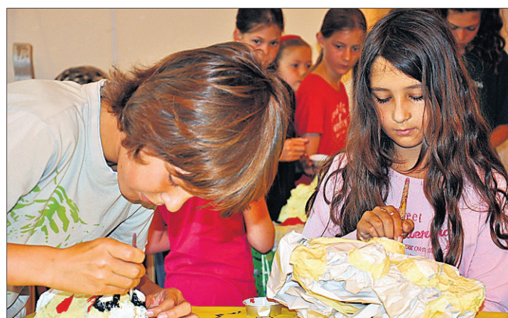
KREATIV TÄTIG SEIN Ob malen, hämmern, sägen, spielen – das Angebot im Chrüzacher ist gross.

Malgruppen Für Klein- und Vorschulkinder, ab 3½ Jahren bis 1. Kindergartenjahr. Ab 13. September bis 16. Dezember, jeden Montag 16–17 Uhr, Mittwoch 9.30–10.30 Uhr, Donnerstag 14.30–15.30 Uhr. Leitung: Heidi